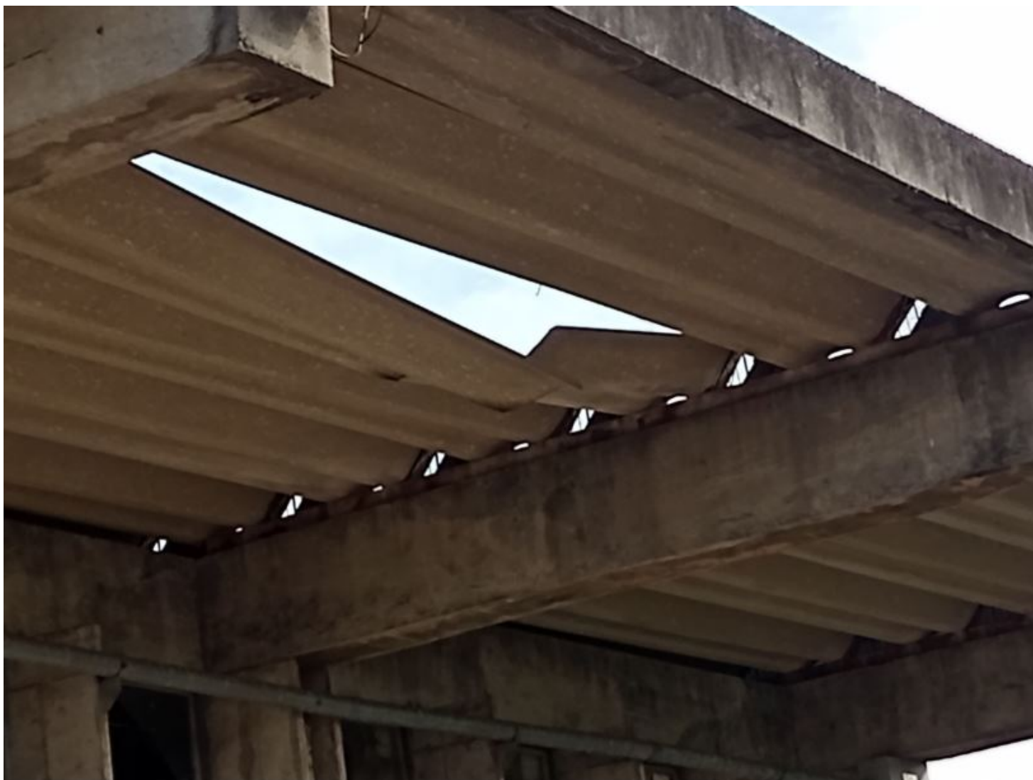
Imagem III – Telhado da Estação Ferroviária de Curitiba comprometido após fortes precipitações