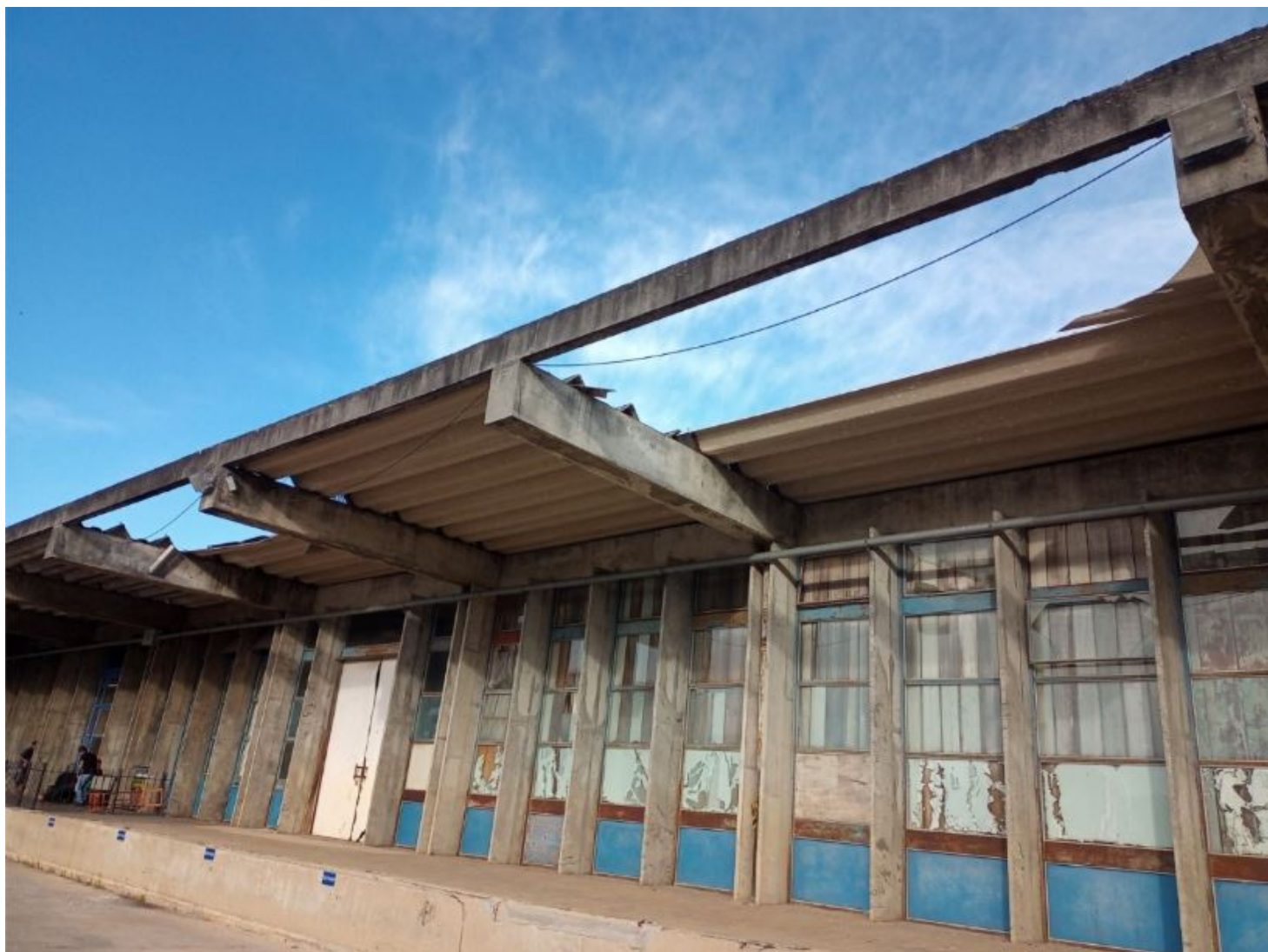
Imagem I – Vista geral do local com queda do telhado