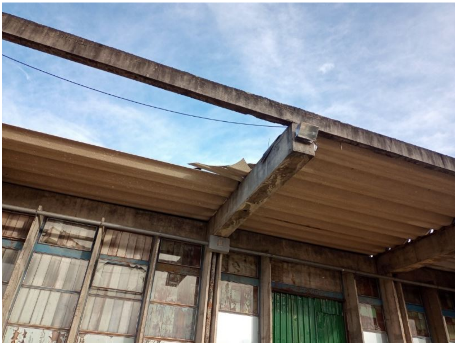
Imagem II – Detalhe do beiral da Estação Ferroviária de Curitiba: resto de telha com risco de queda Fonte: Urbanização de Curitiba S/A (abril/2022)